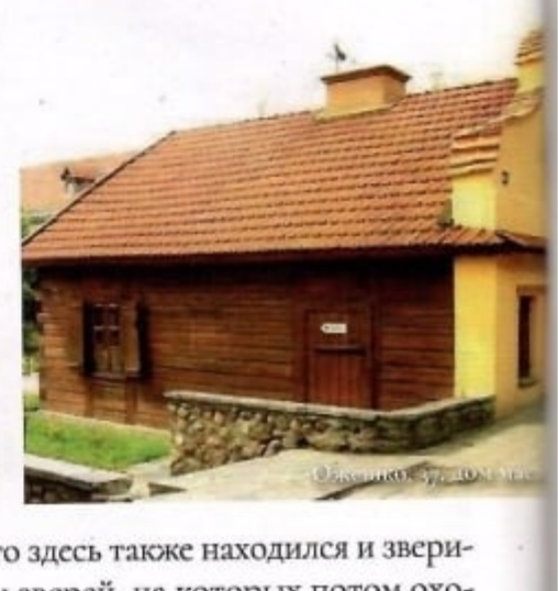
Деревянный дом, 15 век

Ещё одна группа «москвитов» поселилась в Гродно после битвы под Оршей в 1514 году – также в качестве пленных. Но уже спустя дюжину лет, оценивая их большое значение для развития города, великий князь Сигизмунд Август дарит им «поспол с местом права... майборского вживати». Жителям Гродно была также и польское купцы и ремесленники. Но большинство населения, конечно же, составляли белорусы, или как их называли в то время – литвины. Около 10 процентов гродненцев составляли евреи, которые также как и русские, впервые появились на улицах Гродно при князе Витовте. Согласно секрету великого князя Александр 1494 года, все евреи должны были покинуть пределы Великого княжества Литовского, а их земли передали христианам. Впрочем, уже через 9 лет всё тот же Александр позволил им вернуться в Гродно, но своё имущество им надлежало выкупить. Короли Сигизмунд Август и Стефан Баторий подтвердили привилегии гродненским евреям. Целый еврейский квартал был возведён на бывшем посаде – ныне улица Большая Троицкая. В 1575–1578 гг. здесь была возведена первая каменная синагога.