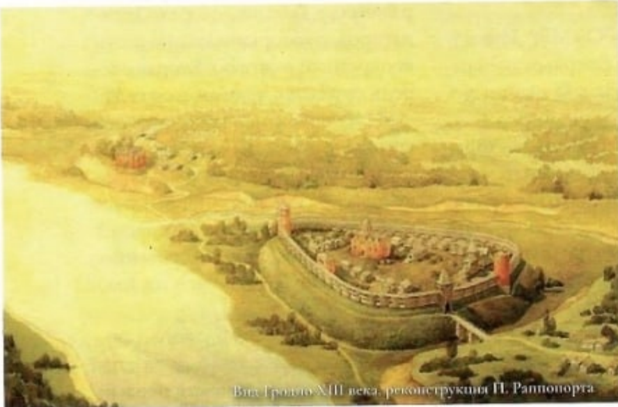
Вид Гродно XIII века, реконструкция П. Раппопорта

Сергей ЗАНЕВСКИЙ