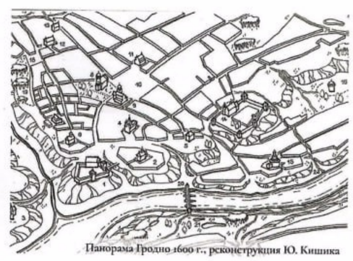
Панорама Гродно 1600 г., реконструкция Ю. Кишика